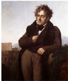
Portreto de F.-R. de Chateaubriand, (detalo; ĉ. 1807)

Girodet-Trioson, Muzeo de Saint-Malo, Bretonio, Francio