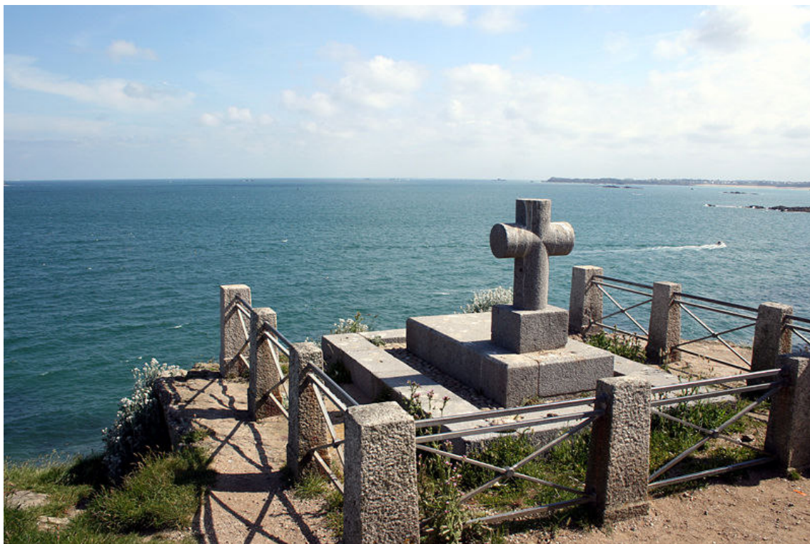
Tombo de Chateaubriand sur la insulo "Grand Bé" en Saint Malo