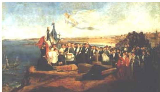
Entombigo de Chateaubriand sur la insulo Grand-Bé, la 19-an de Julio 1848, Valentin-Louis Doutreleau, oleo sur tolaĵo, Foto de Michel Dupuis, komunika servo, urbo de Saint-Malo.