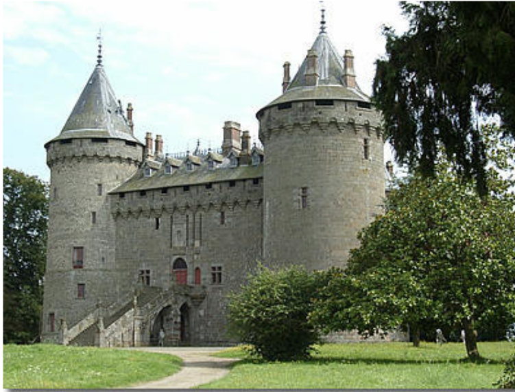
Kastelo de Combourg (vizitebla)